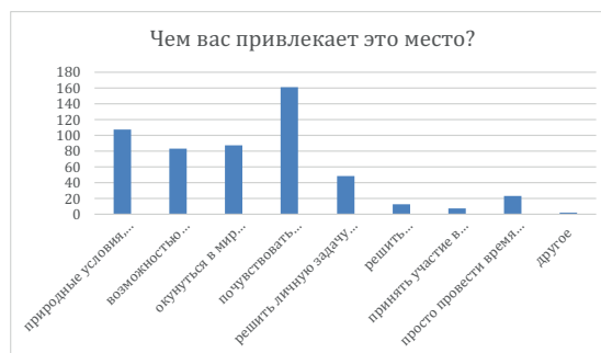
Рис. 3. Диаграмма реакций на вопрос о специфике привлекательности Аркаима