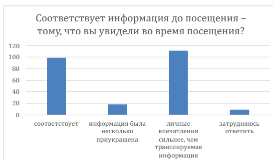
Рис. 2. Диаграмма реакций на вопрос о впечатлениях от Аркаима

При ответе на вопрос о соответствии ожиданий наиболее популярными вариантами ответа стали «соответствует» (99 реакций) и «личные впечатления сильнее, чем транслируемая информация» (111 реакций) (рис. 2).