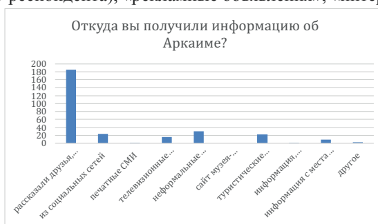
Рис. 1. Диаграмма реакций на вопрос об источнике информации об Аркаиме

При ответе на первый вопрос (об источнике информации об Аркаиме) наиболее популярным оказался вариант ответа «рассказали друзья, знакомые» (185 реакций), тогда как варианты «печатные СМИ» и «телевизионные репортажи» набрали 2 и 16 реакций соответственно (рис. 1). Среди свободных ответов: «ролик Задорнова на ютубе» (3 респондента), «рекламные объявления», «интернет», «книга Здановича»,